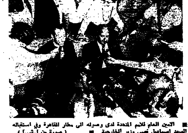
السيد اساميل تهيدي وزير الخارجية

الجيش الروحي للتحرير نفتت الخطبة الحكمة في لبنان ما كانت تسمية الجيش الروحي : فقد هبت رياح التغيير من داخل الكنيسة ولم يعد الطران غريفور حداد وحده ، بل صارت القوى التي تعني خارج العصر وحيدة . والبطش يقول ان الرصاص الذي لم يستطع قتل لبنان فتح عينه على الحقيقة . وتحتل الخطة التي ممجزة . وهكذا جاء الصوت الصارخ في البيرة والداعي الى التغيير من بيان مجلس البطرك الاسكندرية الكاثوليك الى توصيات المجلس الاداري للجمعية اللبنانية المروية والتي اعلم .